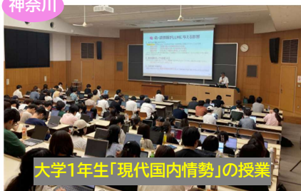
大学1年生「現代国内情勢」の授業