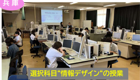
選択科目「情報デザイン」の授業