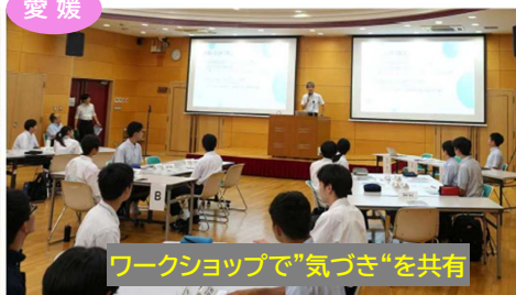
ワークショップで“気づき”を共有