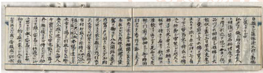
安達清一郎日記 1860年4月4日条