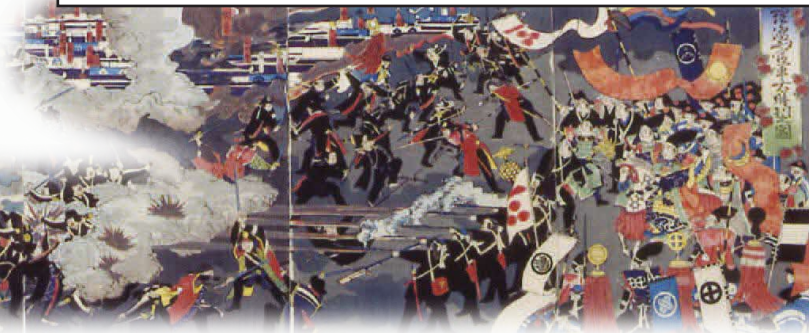
毛理嶋山官軍大勝利之図