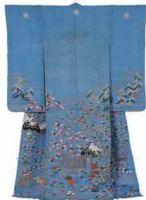
打掛（淡浅葱麻地御所解文様染織帷子）江戸後期