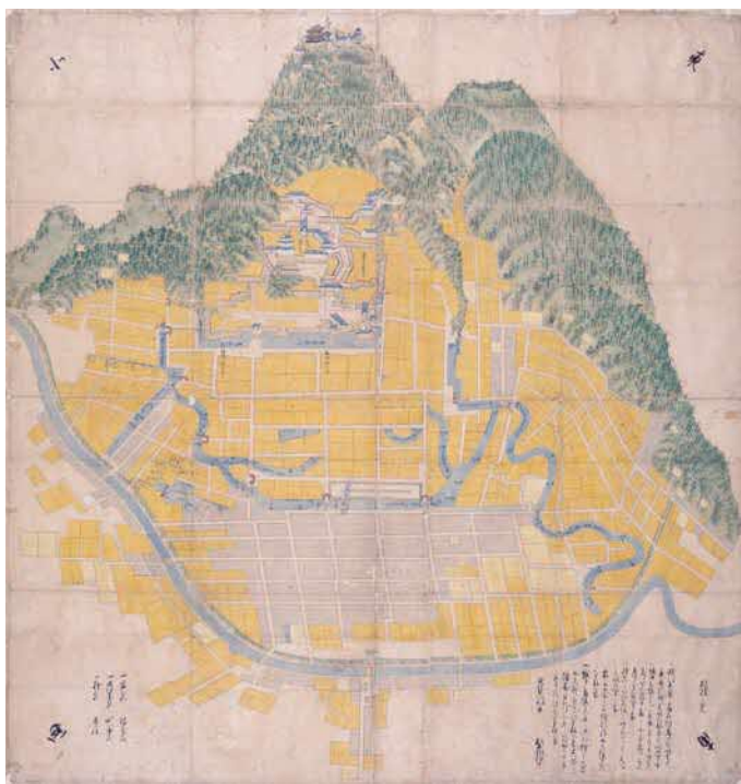
鳥取城修復願図 延宝8年（1680） 鳥取城修理について幕府へ提出された鳥取城と城下町絵図の写し