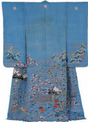
打掛（淡浅葱麻地御所解文様染織帷子）江戸後期