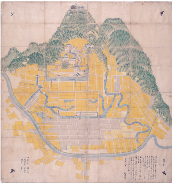
鳥取城修葺願図 延宝8年（1860） 鳥取城修理について幕府へ提出された 鳥取城と城下町絵図の写し