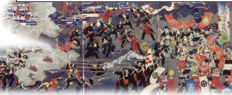
毛里嶋山官軍大勝利之図