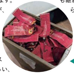
リサイクルされるカラーチューブ

得た収益(年間1.5~2万円)を近隣の児童養護施設や動物保護施設への寄付に充てています。活動を通じて地域の方々に喜んでいただけることが、スタッフにとっても大きなやりがいとなっています。限られた資源を有効活用しながら地域社会への貢献にもつながる取り組みとして、今後継続していく予定です。さらに、同業他社との連携体制を整え、活動のさらなる拡大も目指しています。