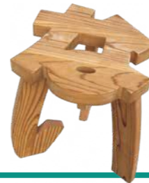
高校生と共同開発した「ナイスなイス」

りました。こうした取り組みは、若い世代に地域産業の可能性を伝えるとともに、社員にとっても“仕事の意義”を再認識する機会となっています。 さらに、端材やおが粉の活用など、限られた資源を無駄なく使い切る工夫も他業種の企業と共に進めています。大量生産ではなく、必要な分を丁寧に使い切るものづくりを通じて、地域資源を次世代へつないでいくことを目指しています。