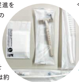
導入している バイオマスアメニティ

40%増加しています。これらの取り組みは環境配慮にとどまらず、業務効率化や原価改善といった経営面での効果にもつながっています。さらに、社内では従業員一人ひとりが持続可能性を意識し、日常業務の中で改善方法を模索する風土が醸成されています。 今後も宿泊施設としての役割を果たしながら、環境と地域の双方に貢献する経営を継続し、持続可能な観光地づくりを目指していきます。