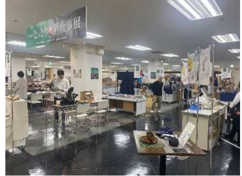
第18回ととりの手仕事展