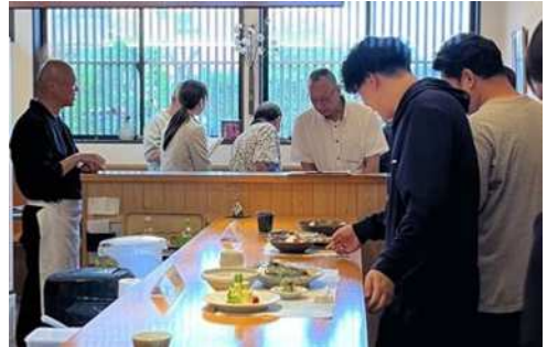
食を彩る「ととりの器」展示会