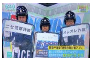
NHK出演による広報状況