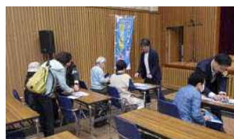
白ウサギ企画での広報状況