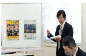
公庁会議での広報状況