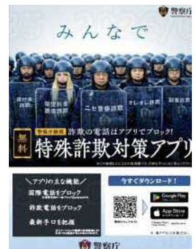
特殊詐欺対策アプリ