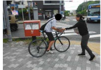
【鳥取大学自転車利用者マナー