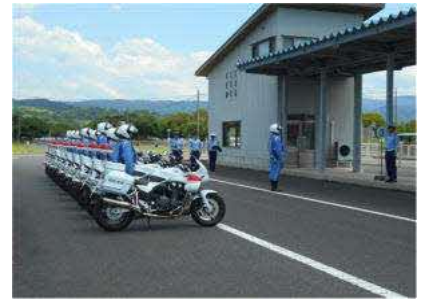
【街頭広報出動式の状況