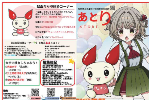
《《広報誌「あとり」第3号 (R7.9.16 発行)》》