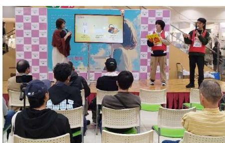
＜＜献血推進サークル活動紹介＞＞