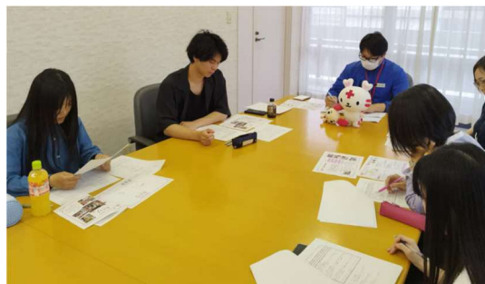
《《発行に向けた打ち合わせ会議の様子》》