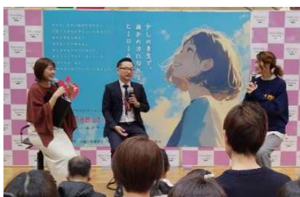
＜＜木村沙織氏によるトークショー＞＞