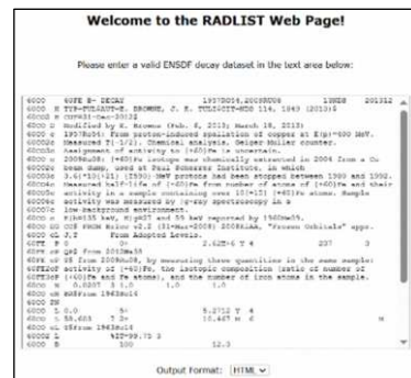
図 1 Web プログラム版 RADLIST

測定法 No. 29 付録 1.2(1)3)では、ENSDF データファイルから核データを抽出する方法として ENSDF 用の配布プログラムである「RADLIST」の使用を紹介しているが、2025 年 3 月現在ではプログラムとして配布はされておらず、代わりに Web 上で動作するプログラム (4) （以下「Web プログラム」という。）として提供がされている（図 1）。