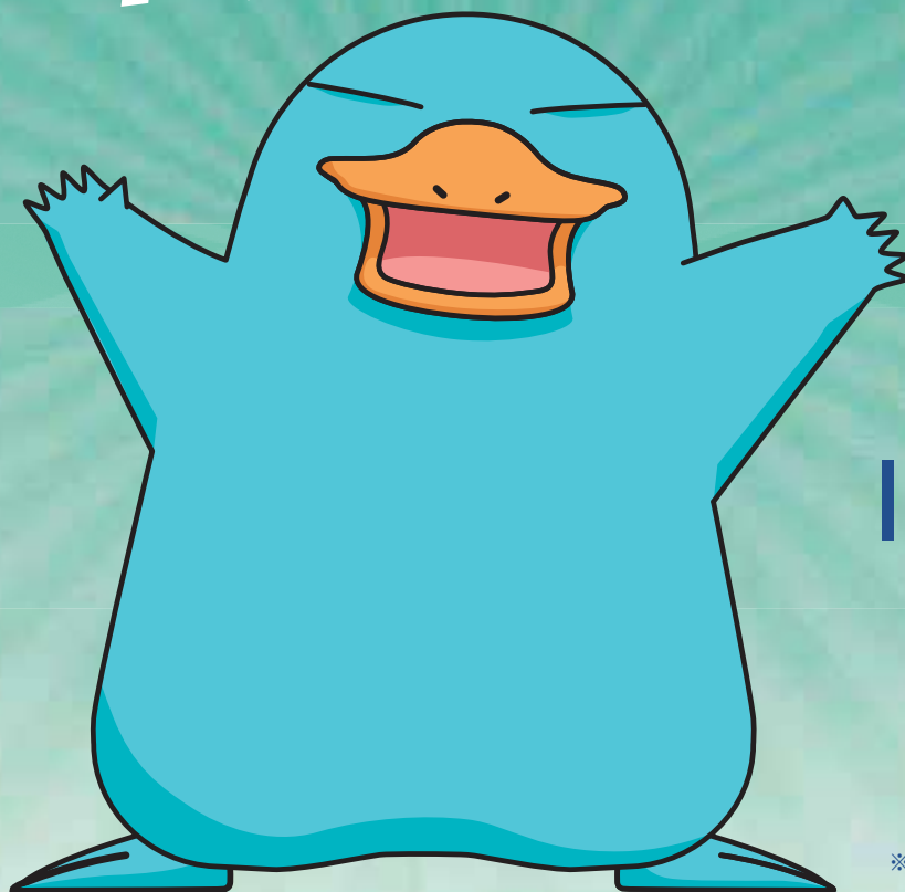
カモノハシのイコちゃん