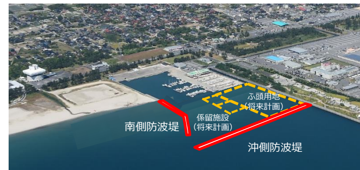
境港公共マリーナ拡張計画(整備イメージ)