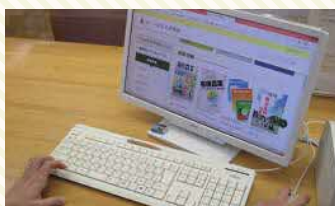
「ルール電子図書館」

このほか、新規就農関連、スマート農業関連などの農業ビジネスに役立つ本、『現代農業』『農業および園芸』などの農業関連雑誌も多数所蔵しています。様々な場面で広くご活用ください。本や雑誌は、市町村立図書館を通じて貸出もできます。