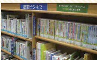
農業ビジネス関連本