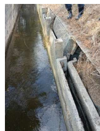
弓浜干拓地 水路の破損