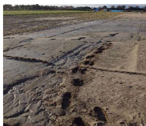
④ 彦名干拓地 農地液状化等（米子市）