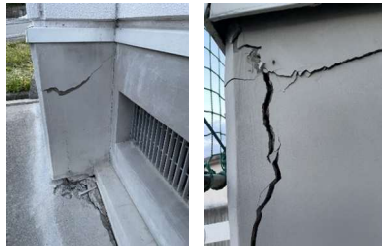
⑤ 南部中学校 体育館の基礎部分のひび割れ（南部町）