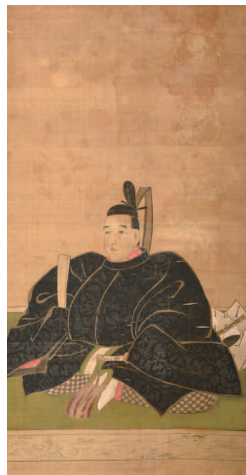
3代藩主池田吉泰肖像