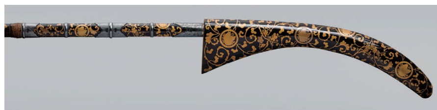
梅唐草蝶文蒔絵難刀拵 護身用として用いられた武具。婚礼道具のひとつ