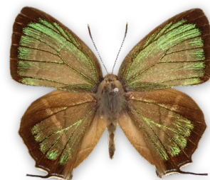
ヒサマツドリシジミ 久松山ではじめて確認された蝶。