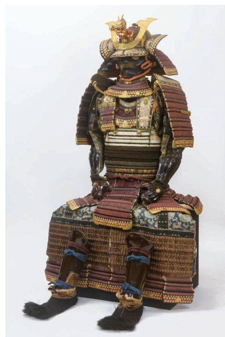
いろいろなおどしどうまる いけだ よしやす 色々威胴丸具足(池田吉泰所用甲冑) 3代藩主池田吉泰所用の具足