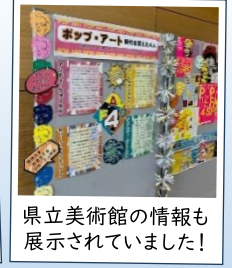
県立美術館の情報も展示されていました!