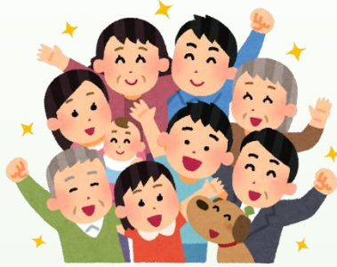
みんなで集い学び合う生涯学習！