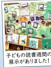
子どもの読書週間の展示がありました!