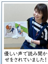
優しい声で読み聞かせをされていました!