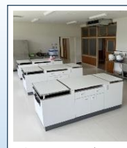
新しく調理室が作られました!