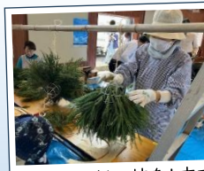
カットした杉の枝を1本ずつ差し込み、さらにカットして形を整えていきます!