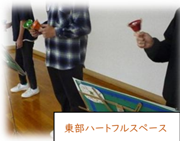
東部ハートフルスペース