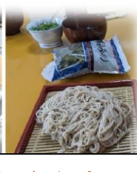
西部ハートフルスペース