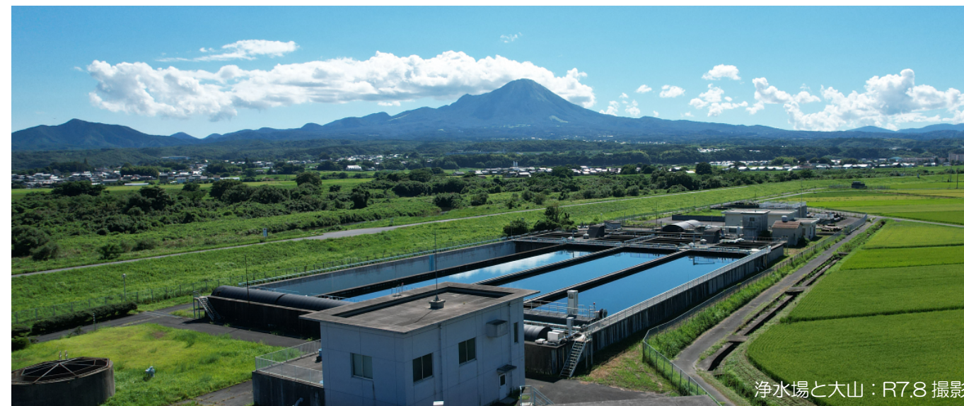
浄水場と大山：R7.8 撮影