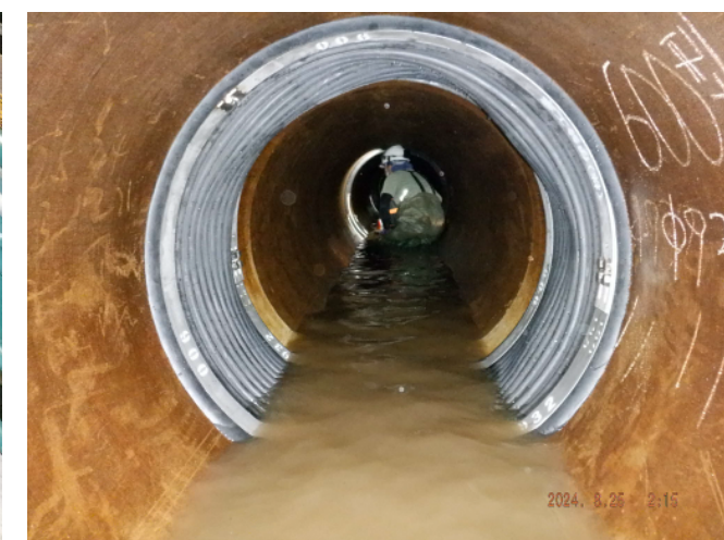
内面バンド設置完了

令和7年11月8日（土）から9日（日）にかけて計画断水（内面バンド設置）と米子市道改良にかかる本管布設替工事を予定していますので、ご協力よろしくお願いいたします。