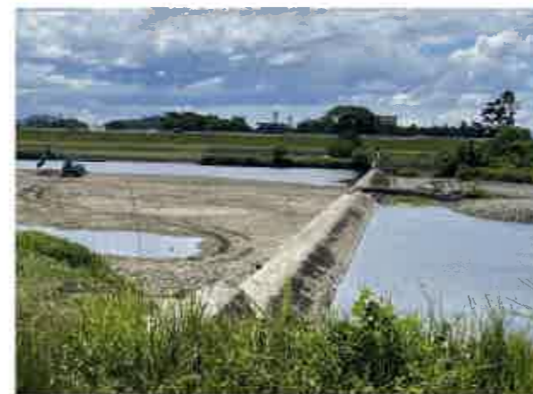
▲瀬切れ(堰を水が超えない)状況【R4.7.6車尾堰】