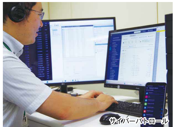
サイバーパトロール