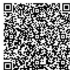
申込フォーム QR コード