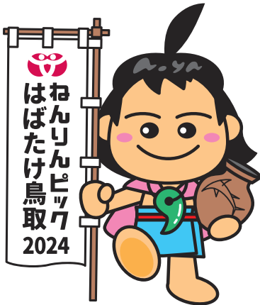
あおやかみじろう

鳥取市青谷上寺地遺跡から出土した人骨をもとに復顔した青谷弥生人「青谷上寺朗」をモチーフにしたキャラクター「あおやかみじろう」を大会PRキャラクターに採用しました。