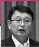
前田 伸一 議員