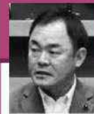
福田 俊史 議員

答 ①鳥取県独自で撤去に備えた供託・積立制度をつくり、負の遺産を残さない②第三者的な調査の権能を担保して、当事者に寄り添った仕組みづくりをする③思い切った防除対策が出穂期に間に合うよう判断した。