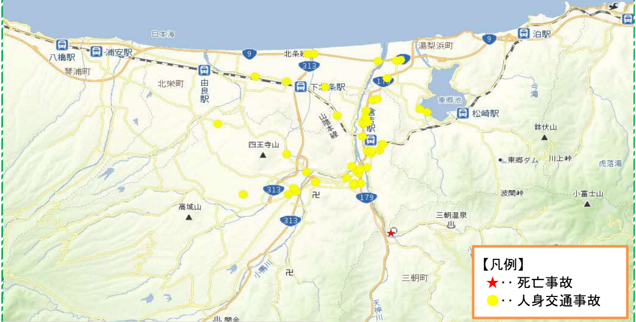
人身事故発生状況 令和7年12月～令和8年5月