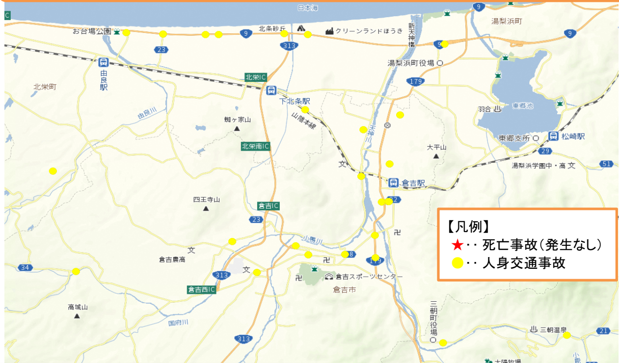
人身事故発生状況 令和7年6月～令和7年11月