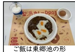
ご飯は東郷池の形