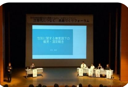
【日本女性会議レガシーイベント（10月）】