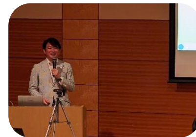
【ジェンダーバイアス解消セミナー（12月）】