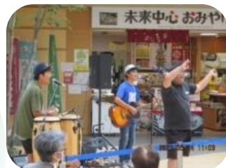
【前回イベントの様子】