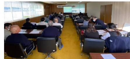
【企業での研修の様子】

講師をお探しの場合は様々な分野の講師登録がある「人材バンク」もご利用いただけます！まずはご相談ください。