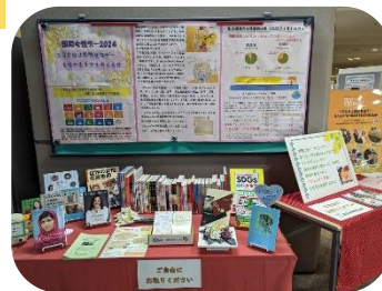
【↑年間を通じた様々な企画展示↓】