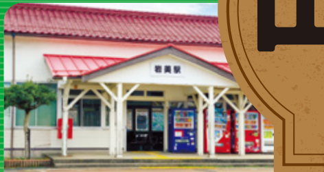
岩美駅 いわみえき Iwami Station