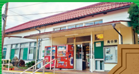
青谷駅 あおやえき Aoyama Station