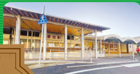
香住駅 かすみえき Kasumi Station