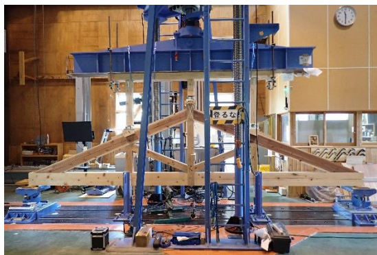
県産材製材品の実大試験状況

中規模建築物に木材・木構造を活用する取り組みが全国的に進んでいます。中規模建築物の木構造には性能の明らかな製材品が必要とされるため、鳥取県内でも機械によって性能の格付けを行う「機械等級区分」の製材 JAS 認定を取得する業者が増加し、木構造に関する研修会等が開催されるなど、中規模建築物に対する製材・建築関係者の関心が高まりつつあります。そこで林業試験場では、全国的にも珍しい県産材製材品を使ったトラス（木構造の一種）の実大強度試験を実施しました。今回はトラスの破壊状況と強度測定の結果を紹介します。