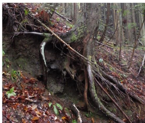
山地斜面での根の展開状況

今回の報告では、斜面崩壊の発生源となる移動体と呼ばれる部分に生育する樹木の根系に焦点を当て、その特徴などについて紹介します。