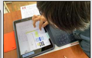
通級指導での「デージー教科書」活用の様子

読むことに困難さがある場合、読むことへの負担感や苦手意識から、読むこと自体を嫌がるようになります。内容の把握や知識の習得がうまくできず、結果として学習意欲の低下にもつながりやすいです。