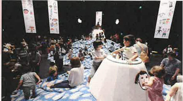
小沢剛《あなたか誰かを好きにように、誰もが誰かを好き【劇場版】》2015 いわき芸術文化交流館アリオス

1961年アルゼンチン生まれ。現在はニューヨーク、ベルリン、チェンマイを拠点に制作活動を行う。作品と鑑賞者の間の壁を取り払い、体験と交流に焦点を当てた参加型の作品で知られている。主な展覧会に2020年「Fear Eats the Soul」(グレンストーン美術館、ポトマック)、2019年「Rirkrit Tiravanija: Who is afraid of red yellow and green.」(ハーシュホーン博物館、ワシントン D.C.)ほか、ヴェネツィア・ビエンナーレをはじめ、国際展にも多数参加している。国内では2022年の岡山芸術交流にてアーティスト・ディレクターを務めたほか、2015年「誰が世界を翻訳するのか」(金沢21世紀美術館、金沢)など多数の展覧会に出品。