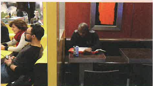
高山明/Port B《McDonald's University@Frankfurt》2017