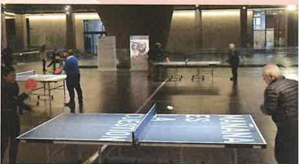
リクリット・ティラヴァニ《Untitled 2016 (tomorrow is the question-mañana es la cuestión)》CCK, Buenos Aires, Argentina