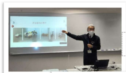
Kelas Sains Klasifikasi organisme

☆Ini merupakan sekolah menengah pertama yang belum pernah ada sebelumnya di Prefektur Tottori. Sekolah ini berada di lantai 1 Bagian Informasi Literasi, Pusat Pendidikan Prefektur Tottori, Koyama-cho Kita, Kota Tottori. Ini adalah sekolah malam yang dirancang untuk mengakomodasi kemampuan individu setiap siswa sejak awal studi. Kelas diselenggarakan empat jam per hari, lima hari per minggu, menggunakan komputer atau tablet.