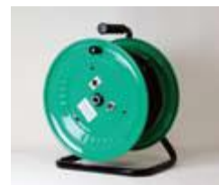
ドラム型 ループアンテナ