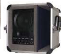
アンプ付スピーカ