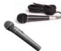
マイク （有線・無線）