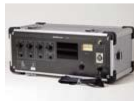
ヒアリングループアンプ