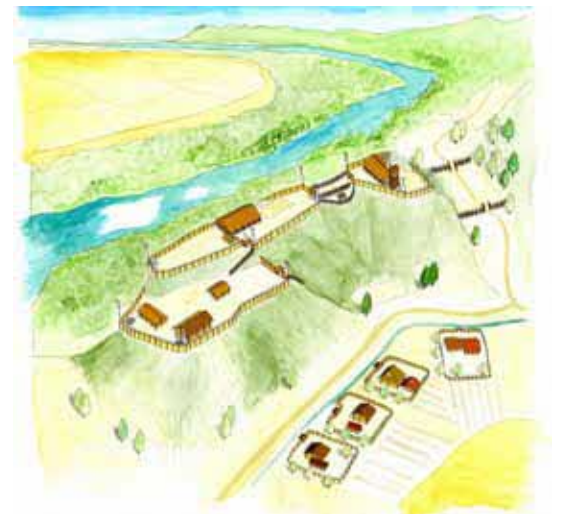
静間城の復元イラスト（16世紀初め頃） (提供：島根県埋蔵文化財調査センター)