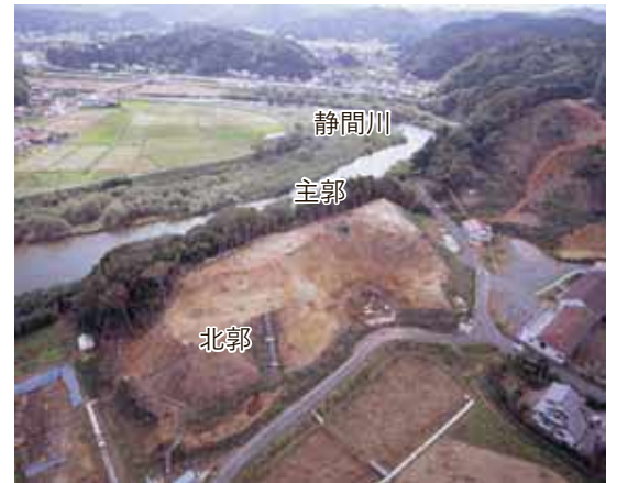
静間城を北西上空からみた写真

静間城は15世紀後葉から16世紀前葉頃まで使われていたようで、建物が火災に遭った後に放棄されたようです。