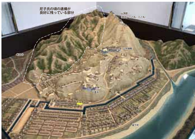
富田城の復元模型（吉川氏・堀尾氏の頃） 模型：安来市教育委員会 蔵