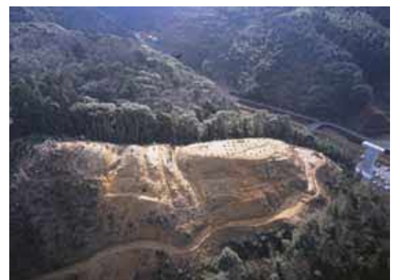
普源田砦を北西から見た写真

城がある辺りでは、浜田市の西側を治めた三隅氏と益田市に本拠を置く益田氏が争っていて、城が使われていた時期は両氏の争いの最後の時期に当たることから、その関連性が注目されます。