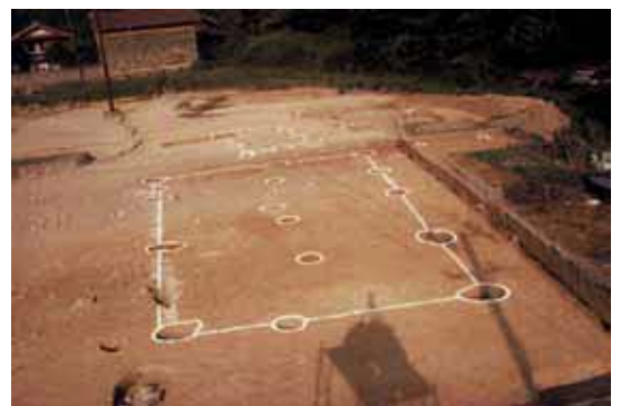
新宮谷遺跡で見つかった建物跡

発掘調査で、廂付き建物などが確認されるとともに、粛清の際の火災の焼土などを廃棄したと思われる土坑からは屋敷で使われた中国製の陶磁器などが出土しました。