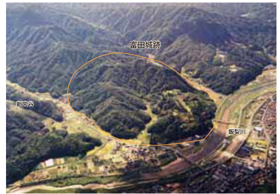
富田城を北上空から見た写真