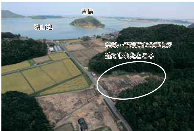
遺跡周辺を南西上空から見た写真

見つかった建物はあまり大きなものではありませんが、都から派遣された役人など高い身分の人に上申する内容が書かれた「前白木簡」が出土したことから、ここにあった施設が公的で重要な施設だったことがうかがい知れます。また、土器に書かれた文字には「船」や港を表す「津」から湖山池を介した水運を、「馬」から施設の近くを通っていたと思われる古代山陰道との関わりが考えられます。