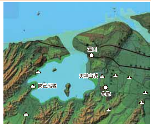
中世の湖山池周辺の城跡と町

室町時代の終わり頃になると、政治の中心地である守護所が岩美町にある二上山城から天神山城へ移されます。守護所はすでに栄えている港や町の近くに置かれることが多く、このことから当時繁栄していたことがうかがえます。