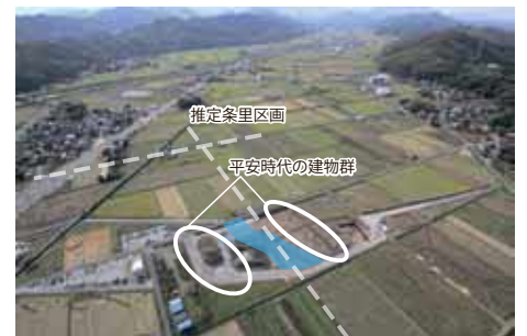
遺跡周辺を北東方向から撮影した写真

大桝遺跡があるあたりはその中でも水田がまとまってあったと考えられます。この水田が集中する部分の西側に平安時代初め頃の建物群が見つかっていて、荘園を開発、運営するための施設だった可能性があります。