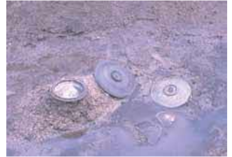
流路の底で漆書土器が見つかったようす

流路からは墨で文字が書かれた土器も見つかっていて、地形または地名を表していると思われる「深縁」と書かれたものは良田平田遺跡でも出土しています。