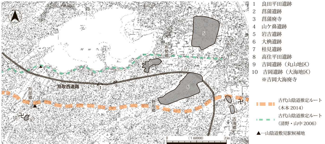
高草郡における主な古代遺跡（『良田平田遺跡』2014 から引用、一部改変）