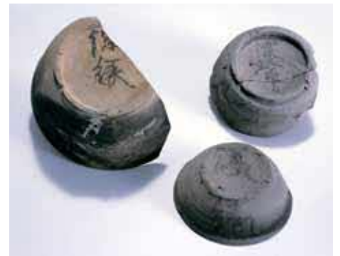
流路で見つかった墨書土器