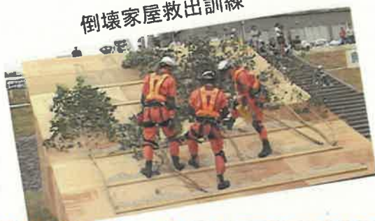
倒壊家屋救出訓練