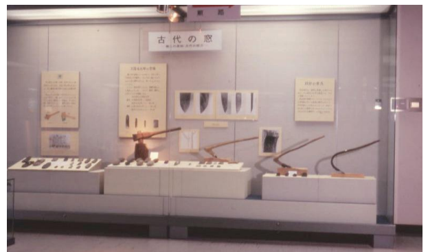
「古代の窓」展示風景(昭和50年代)

昭和62・63年度には、開館後初めてとなる全体的なりニューアルが行われたが、この時、音声や映像の展示装置も加わっている。復元民家では、センサーにより鳥取県民謡緊急調査報告(昭和62年)の成果である民謡を自動で流す音声装置を設けた。また、それまで8ミリフィルムやVTRによる映像記録を撮りためていたが、民俗行事を番組として編集したものをビデオテープ(ベータ)で視聴者が選択し鑑賞する機械を設置したのもこの時である。その後も毎年民俗行事を撮影して編集する事業は平成年間まで続き、ビデオテープからレーザーディスク・DVDと媒体を替え、デジタルの現代はホームページ上(鳥取県の民俗行事等)で閲覧できるようになっている。