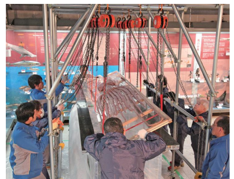
ダイオウイカ液浸水槽の交換作業(H25年)。