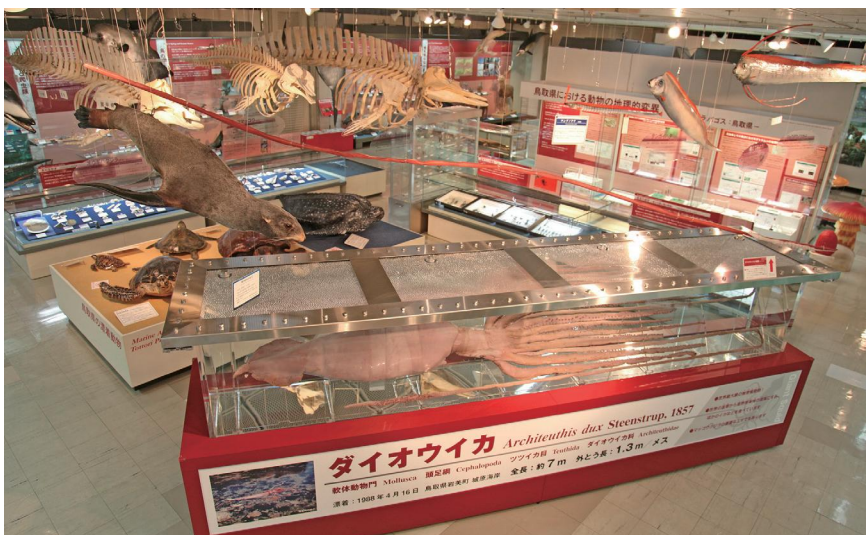
ダイオウイカおよび漂着動物(H25年撮影)。