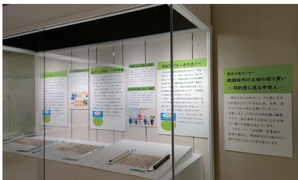
「歴史の窓」展示風景(上：平成後期、下：R5年)

平成の展示替えでは、体験参加型展示装置として、考古分野では土器パズルと短甲模型の試着、近世分野では鳥取県域の歴代支配大名を色分けした領地パズル、民俗分野では民具(竿ばかり、唐箕)を使ってみようという体験コーナーを設けたが、令和時代になり、新型コロナウイルス感染症拡大防止のため撤収している。