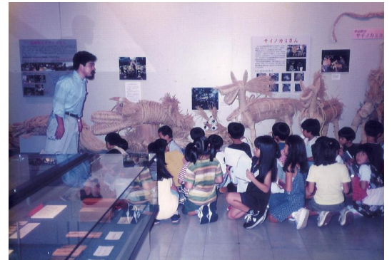
展示解説風景(民俗)