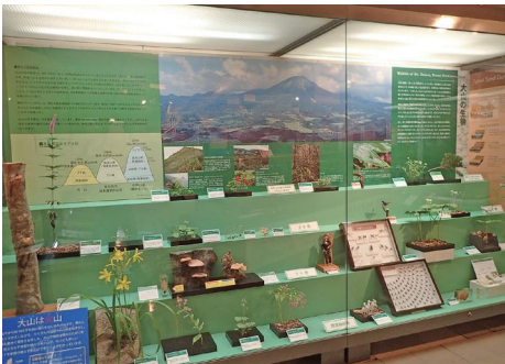
大山の生物展示の変遷。上からS55年、H元年、R5年。