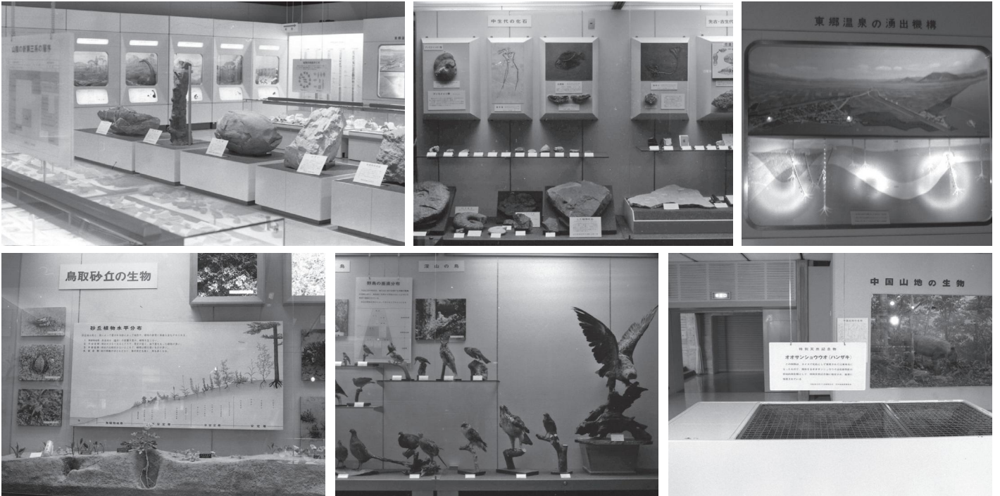
開館間もないころの常設展示室。上段左から：大型地学標本と生物の歴史ジオラマ(S51年撮影)、各地質時代を代表する化石(S56年撮影)、東郷温泉の湧出機構(S56年撮影)。下段左から：鳥取砂丘の生物(S51年撮影)、鳥取県の野鳥(S56年撮影)、オオサンショウウオ飼育水槽と中国山地の動植物ジオラマ(S59年撮影)。