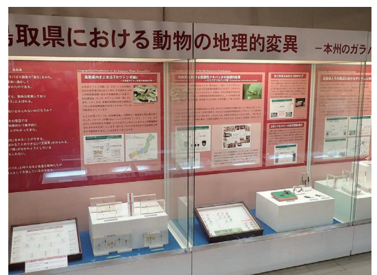
R5年時点の生物展示室。上からオオサンショウウオ液浸標本および飼育水槽、鳥取砂丘の生物、中国山地の動植物ジオラマ、鳥取県における動物の地理的変異。