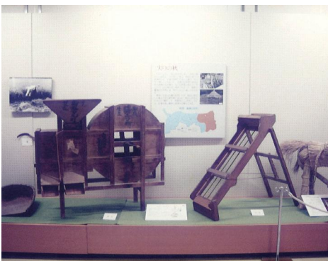
展示風景(「生活の中の道具」、「伝え継ぐ心」)