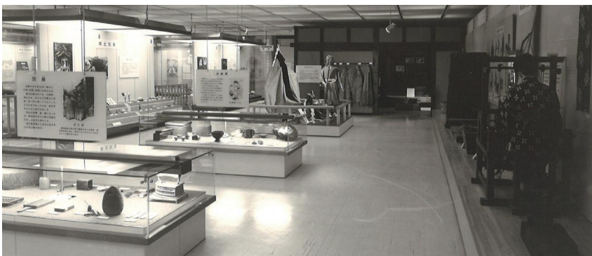
民俗展示風景(出口付近から復元民家を望む)