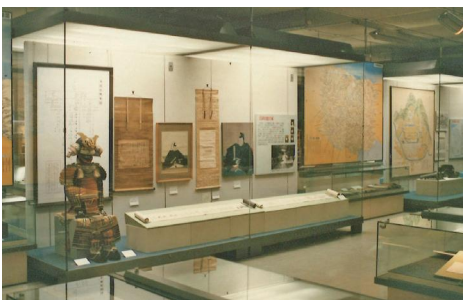
平成初期の展示風景(上から考古、古代・中世、近世)