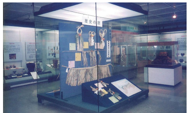
「歴史の窓」展示風景(平成前期)