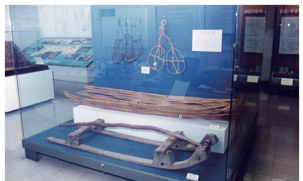
同上。左側には復元竪穴住居模型、旧年表と文化財分布地図が展示されている