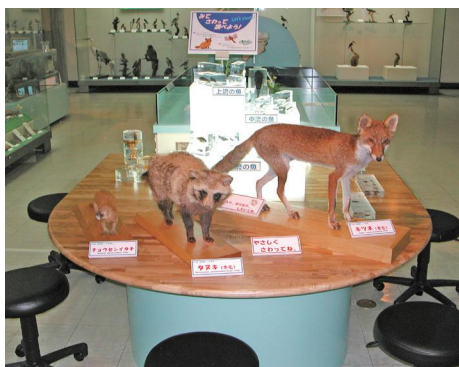
「みて・さわって・調べよう」コーナー(H16年撮影)。

令和2～4年には、当館職員が新種として発見・記載した昆虫ヒョウノセンヒメハナノミについての特別展示コーナーを設けた。