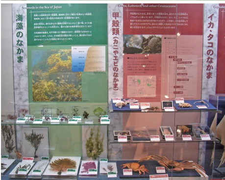
第2回リニューアル後の展示室。上：漂着動物、下：海藻等の分類展示(H18年撮影)。

ジといった身近な鳥獣類の剥製を来館者が自由に触り、感触を体感できるようにした。平成15年には「みて・さわって・調べよう」コーナーを新設し、タッチング剥製に加え透明樹脂封入標本などハンズオン形式の展示を充実させた。なおこれらは、令和元年から世界的に流行した新型コロナウイルス感染症(COVID-19)に対する感染拡大防止のため、令和2年度から中止となっている。