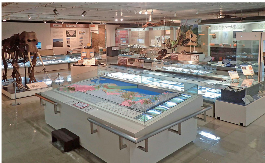
地学展示室の概観。手前に地形地質模型やナウマンゾウ骨格レプリカが見える (R5年撮影)。