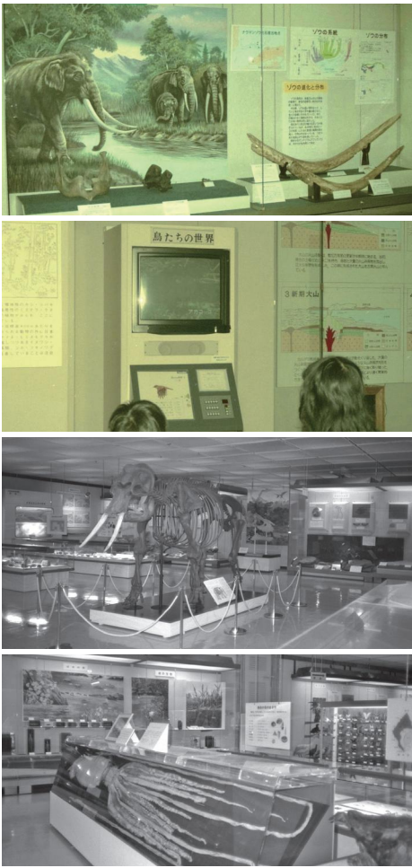
第1回リニューアル後の展示室。上からゾウの進化、レーザーディスク(S62年撮影)、ナウマンゾウ全身骨格レプリカ、ダイオウイカ液浸標本(H元年撮影)。