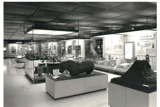
考古展示風景(弥生住居・石馬)