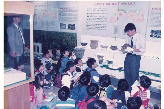
展示解説風景(旧石器・縄文)

50年前の開館当初、1階の常設展示室は、生物・地学展示室(自然分野)に続いて考古・民俗展示室があり、さらに現在の学芸棟入口の史料閲覧室の場所に史料展示室があった(昭和57年度まで)。昭和58年4月1日