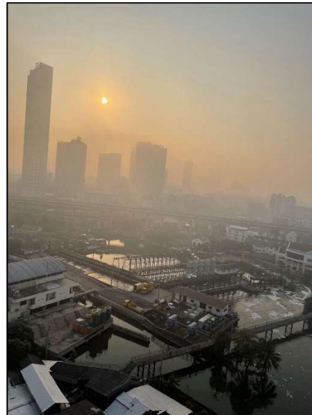
PM2.5の影響でかすんでいる バンコクの朝の風景

例年では雨季に入る5月下旬ごろからAQIが下がるため、あと2か月もすれば状況が改善されるものと思われませんが、来シーズンは乾季入りする前からしっかりとした対策を始めて、大気汚染問題が今年以上に悪化しないことを望みます。