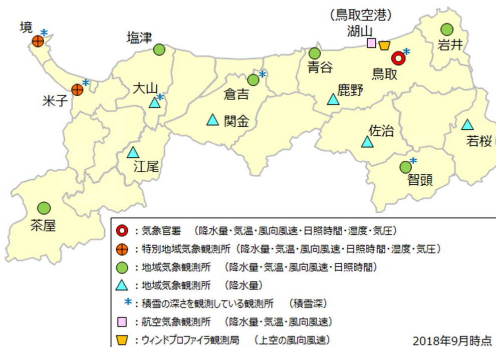
気象観測所配置図