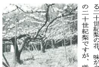
▲二十世紀梨畑風景

2月の晴れた日に、放送センターでの全国各地の芸能大会を老婆と共に見に行く。会場は観客でいっぱい。何と故郷鳥取の因幡の傘踊りがトツ臣とニックネームを付けられたそうす。現在、湯梨浜町は鳥取県を代表する梨どころ。別所と国信をはじめ町内の果樹園は毎年4月中旬ごろ、梨の白い花で覆われ、梨農家は花粉を付ける交配作業に家族総出で追われます。鳥取県の果花であ