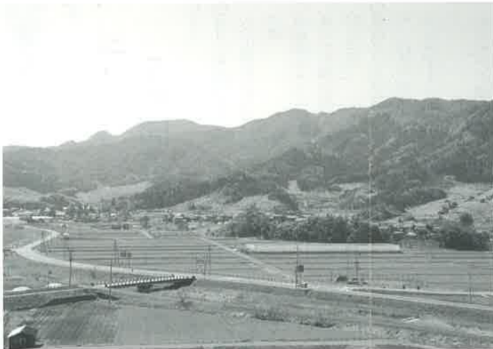
▶新田集落「田んぼの学校イン新田」の様子 ▲湯梨浜町国信の風景

2009年4月30日発行 東京鳥取県人会事務局 〒102-0093 東京都千代田区平河町2-6-3 都道府県会館10F 電話 03(5212)9178 FAX 03(5212)9079 発行責任者 / 上村正明 編集 / 県人会広報部会 http://www.pref.tottori.lg.jp/tokyoffice