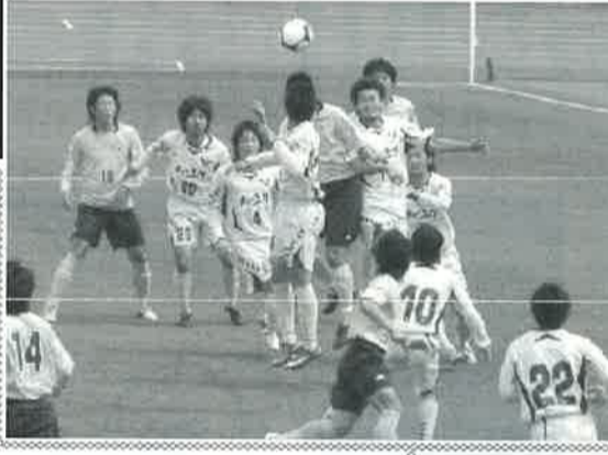
鳥取県サッカー協会

3月15日、サッカーのJリーグ開幕。鳥取県出身の有名選手が出演し番組を盛り上げます。放送日:2009年6月7日(日) NHKBS2 10時54分 13時16分 総集編:2009年6月27日(土) NHKBS2 13時15分(6/7の放送を再編集したものです)