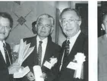
▲左から廣江式県議、小川浩史さん、田川甲さん