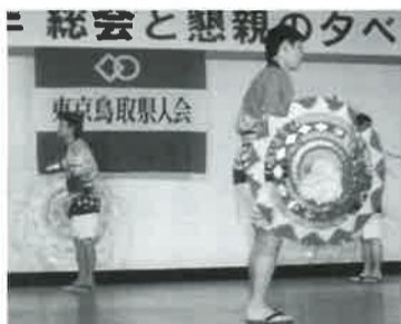
▲しゃんしゃん踊りの舞台