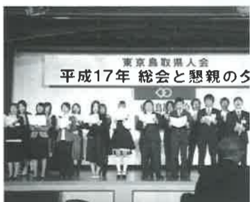
▲学生寮の皆さんが合唱