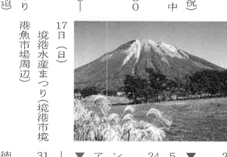
鳥取観光コンベンション協会

9月(祝) 9日(土)〜11日(月・祝) 燕趙園まつり(東郷町 中庭園燕趙園) 10月(祝) 23日(祝) 国立公園大山高原マラソン 全国大会(大山町) 10月 2日(土)〜11日(月・祝) 秋の花フェスタ(倉吉市) 16日(土)〜17日(日) 鳥取三十三万石お城まつり 17日(日) 境港水産まつり(境港市 境港市場周辺)