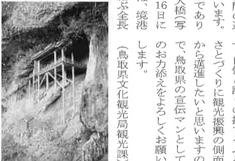
鳥取県文化観光局観光課

たぐさんの温泉地など鳥取の歴史や文化、自然の育んだ情景が思い浮かぶのではないでしょ。うか、これらの鳥取の誇る財産を周囲の人々との語り合いのなかで共有し、その