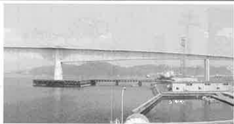
▲江島大橋 10月16日開通

「ふるさと」は遠きにありて思ふものとは、利に帰省できるようになりまして。今でも、鳥取県は豊かな自然が溢れている。秋が深まると、鍵掛峠から大羽田港から鳥取空港、山南壁の山麓に広がる一面が美しく紅葉します。大山や三徳間は一日4便、米子空港は一日5便と、鳥取砂丘と