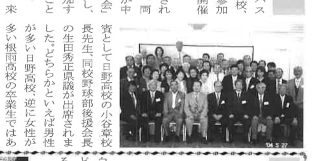
「故郷を語る会」には、来日が多い日野高校、逆に女性が多い根雨高校の卒業生ではあります。

去る5月27日、虎ノ門パスで、旧日野産業高校、根雨高校の同窓生46名が参加し、「故郷を語る会」を開催しました。 両校が日野高校に統合されて4年、今回の同窓会は、両校の60歳代の卒業生30人が中心となってつづいた、金持会が「故郷を語る会」を開催し、長先生、同校野球部後援会長と日野秀正県議が出席され、この二校の卒業生が参加するということ形をとってみることとなりました。