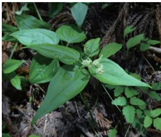
日南町 2016.6.2

■ 選定理由 ：県内では西部の山地に局所的に生育する。林縁の日当たりがよい草地に生育するため、周囲の植物の影響を受けやすい。