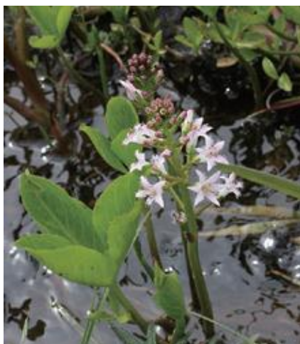
三朝町 2013.5.9

■ 選定理由 ：県内の限られた湿原に離散的に分布しているのみで、個体数も少ない。本種は異形花柱であり、種子繁殖のために長花柱花と短花柱花の個体が近接して生育している必要があるが、その条件を満たすのは県内では2カ所のみである。