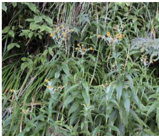
三朝町 2014.9.9