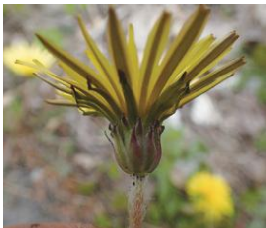
鳥取市 2021.4.9