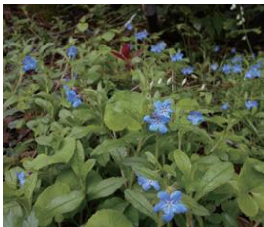
大山町 2021.5.5

■ 選定理由 ：県内での自生地はきわめて限定されており、里山環境の変化により減少しつつある。自生地が互いに隔離されているため、個体群維持に懸念がある。