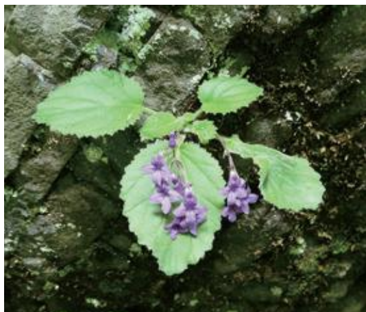
鳥取市佐治町 2021.6.8

■ 選定理由 ：生育適地が少なく県内での自生地はごく少ない。採取圧が高く、盗掘もみられる。