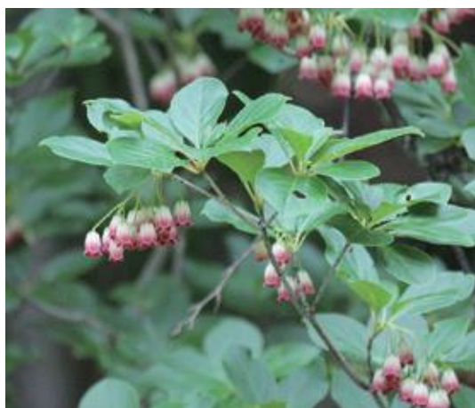
智頭町 2020.6.1