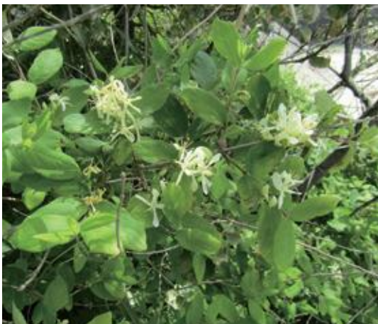
岩美町 2021.5.4