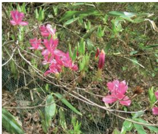
倉吉市 2007.5

■ 選定理由 ：全国的にも分布範囲は限られる。県内では大山周辺に多い。東部では点在する程度。