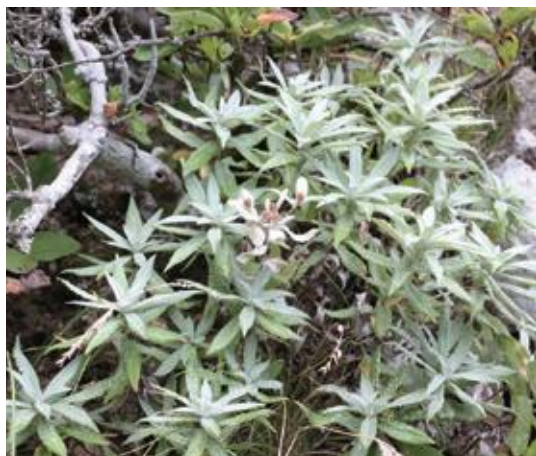
氷ノ山 2012.8.6