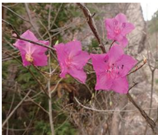
日野町 2020.4.5

■ 選定理由 ：県内の生育地は南西部の花崗岩地域に限定され，生育地，生育個体数ともに限られている。また園芸用採取による個体数の減少も見られる。