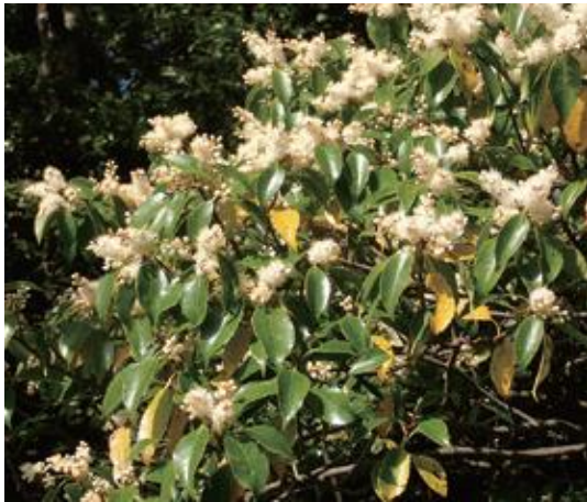
南部町 2015.5.6

■ 選定理由 ：県内では南部町金華山（金華山）のみに自生が知られている。現在のところ絶滅に至る可能性は低いが、局所的で希少性が高い。