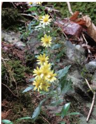
鳥取市用瀬町 2019.11.21

■ 選定理由 ：2002年初版掲載のサンインギクはシマカンギクとイエギク（園芸菊）との雑種で野生植物としての実体がなく、2012年改訂版から野生種であるシマカンギクをその他の重要種として掲載。シマカンギク個体群にはイエギク類との交雑による雑種化（遺伝子汚染）が懸念されている。