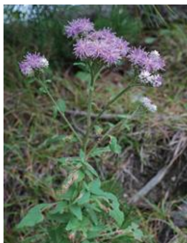
島根県隠岐 2017.8.22

■ 選定理由 ：県内では、三朝町田代高原と船上山の草地で確認されていたが、現在は生育が確認できない。田代高原はシカの食害によりススキ以外の植物が消滅。船上山は火入れ回数が減少し林地化、ササやつる植物の繁茂により消滅した可能性が高い。