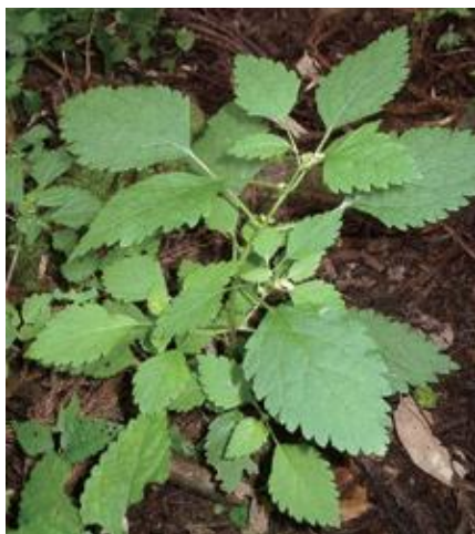
氷ノ山 2005.9.4

■ 選定理由 ：北方系の植物で、県内では氷ノ山のごく一部で確認されていたが、近年の甚大なシカ食害で見つけられなくなった。絶滅のおそれが高い。