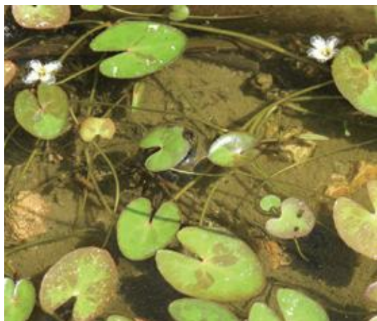
米子水鳥公園（栽培） 2021.9.27

■ 選定理由 ：2005年に中海・安倍処分地で発見された株を米子水鳥公園で系統保存のため栽培している。自生地はすでに埋め立てられており野生絶滅。