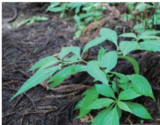
若桜町 2009.9.4

■ 選定理由 ：県内では氷ノ山、那岐山周辺の林下にわずかに生育するが、シカの食害で見つけられなくなっている。