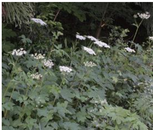
大山町 2016.6.3

■ 選定理由 ：近畿以北に分布する種で県内が分布西限と思われる。県内東部に多く分布するが西に行くほど減少し大山まで。