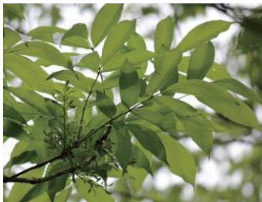
智頭町 2012.5.2 / 撮影：前田雄一

■ 選定理由 ：県内では東部を中心に、渓谷の限られた場所に孤立的に生育する。全国的な分布は関東以西の太平洋側に偏り、日本海側では少ない。