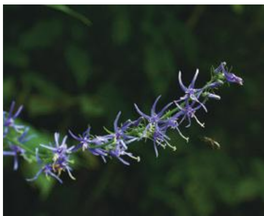
日南町 2017.8.2

■ 選定理由 ：県内では日南町にのみ生育するが、生育地点は減少し個体数も減少している。他の草本類に被圧されている影響が大きい。