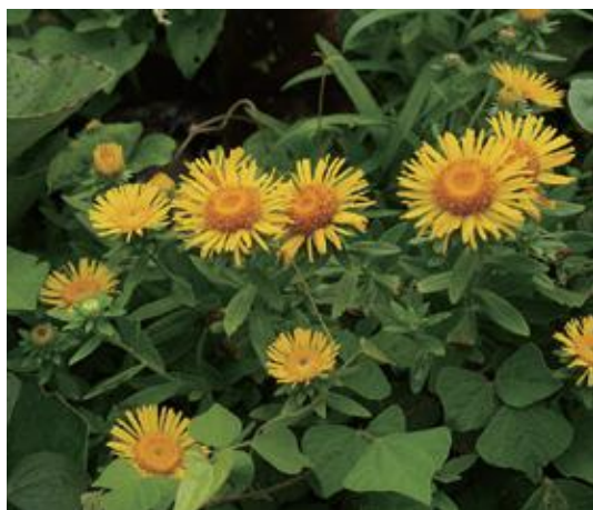
湯梨浜町 2017.7.11

■ 選定理由 ：県内では海岸沿いの草地や山地の草原に見られるが，個体数は少ない。