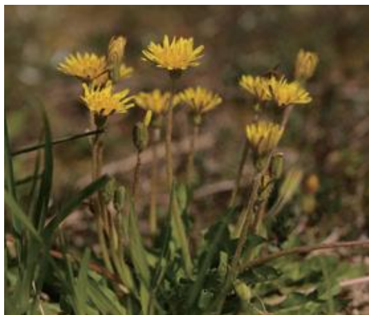
鳥取市用瀬町 2021.4.11

■ 選定理由 ：関西地方から瀬戸内東部地域に分布の中心があり，鳥取県内を含め中国山地北側では生育地が限られる。外来種との交雑による影響も懸念される。