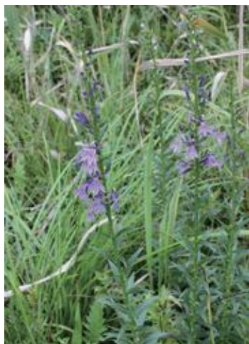
鳥取市国府町 2014.8.14