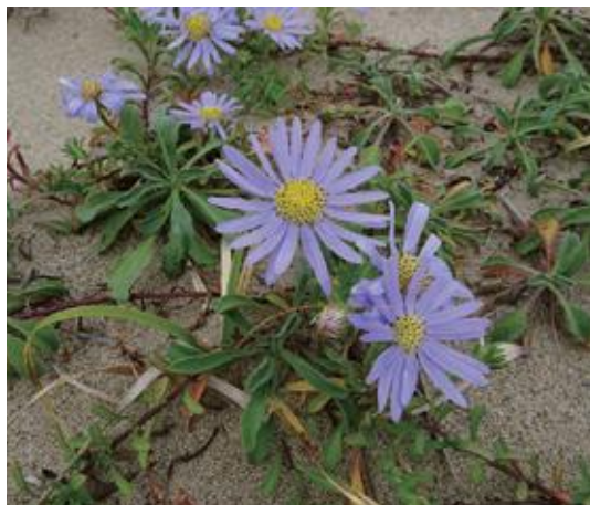
鳥取砂丘 2018.11.6