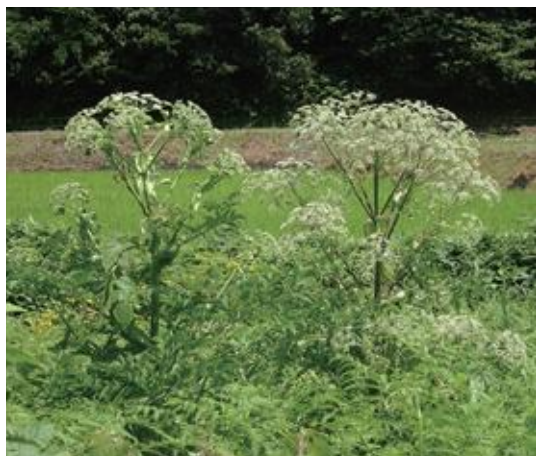
日南町 2021.8.2 / 撮影：藤原文子

■ 選定理由 ：県内では西部の山間地にのみ生育が確認されている。他の植物に被圧されて減少している生育地がある。