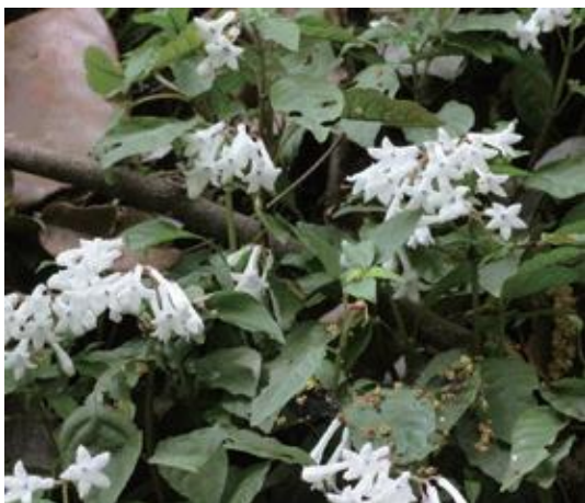
鳥取市 2011.5.9

■ 選定理由 ：県内では多湿な照葉樹林やスギ植林下の林床，神社境内，参道などに群生する。潜在的な生育適地は広そうだが，実際の自生地は限られる。谷川沿いでは増水等で群落ごと流出することもある。