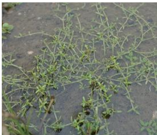
湯梨浜町 2018.9.6

■ 選定理由 ：県内では鳥取市の水田で観察されていたが現在は消失。新しく湯梨浜町内の休耕田でみつかったが、生育状況は不安定で絶滅のおそれが高い。