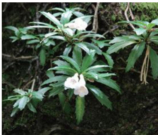
三朝町 2014.8.4

■ 選定理由 ：県内の分布はごく限定されており、種の存続に支障をきたすほど個体数が著しく少ない。生育地の環境はナラ類の枯損等により悪化がみられ、依然として採取圧もある。