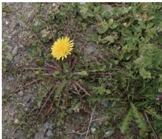
若桜町 2021.4.3

■ 選定理由 ：山間部に生育しもともと孤立していて個体数は多くない。土地改変や利用放棄により個体数がさらに減少することが懸念される。