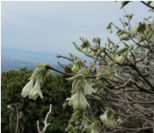
大山 2021.5.4

■ 選定理由 ：大山が模式産地。県内では、大山や氷ノ山のブナ帯に生育する。 ■ 特徴 ：ブナ帯域に生育する落葉低木。若枝は長腺毛が散生するが、後に無毛となる。葉は卵形—長楕円形で鋭突頭，基部は円形，粗毛と腺毛がある。花期は4—6月。花柄の先に2花をつける。花冠は白黄色，漏斗状で下垂する。液果は球形で赤くなり，2個がヒョウタン形になることからこの名がついた。北海道から四国の山地に分布する基本種のアラゲヒョウタンボクとは，子房や花柱の下半分に毛がないことで区別する。