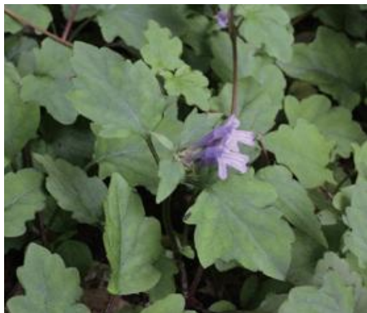
智頭町 2012.6.5

■ 選定理由 ：山林の木陰に生育するが、県内での確認はごく少数でシカの食害により減少して絶滅の可能性が高い。