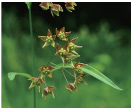
伯耆町 2020.7.2 / 撮影：藤原文子