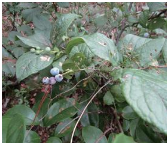
鳥取市福部町 2021.8.20

■ 選定理由 ：県内東部の鳥取砂丘と浦富海岸にて自生確認があるが、個体数は少なく生育基盤が脆弱。