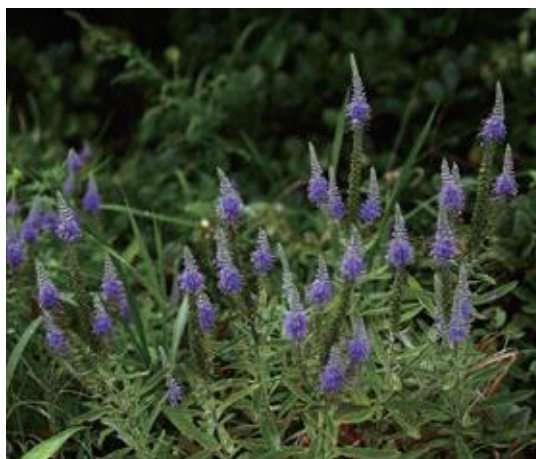
湯梨浜町 2015.9.9 / 撮影：磯江茂秋

■ 選定理由 ：県内では湯梨浜町内のみならずくに生育し個体数も少ない。全国的にも隠岐と京都府北部に分布するのみ。