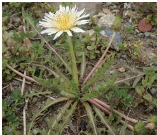
若桜町 2021.4.3