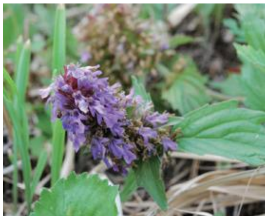
島根県 2015.6.2 / 撮影：矢田貝繁明

■ 選定理由 ：伯耆町内での1977年6月の生育確認記録と1999年出版書籍への写真掲載があるが、度重なる調査努力によっても現在は県内での生育が確認できない。草地の樹林化により絶滅したと考えられる。