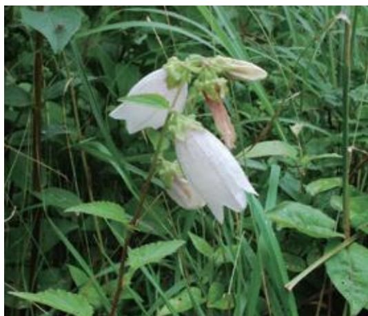
伯耆町 2021.7.6

■ 選定理由 ：県内の生育地は大山山域に限定されており、生育本数も少ない。また県内の生育地は分布西限と思われる。大山山頂付近や登山道脇などに生育している。