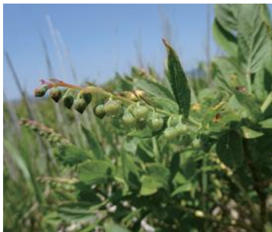
道後山 2021.6.9

■ 選定理由 ：県内西部が分布限界。生育地が限定され孤立していて、個体数も少ない。