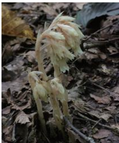
若桜町 2013.8.5

■ 選定理由 ：自生環境の変化に弱く、生育条件が限られている。県内の生育地は大山と氷ノ山山系に限られており、絶滅のおそれを検討する必要がある。