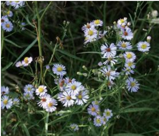
米子水鳥公園 2006.10.16