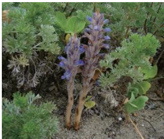
鳥取市 2014.6.4

■ 選定理由 ：県内の海浜に生育するが生育地は限定的で、生育環境は攪乱され、生育基盤が脆弱である。