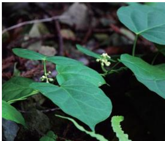
倉吉市 2014.9.8