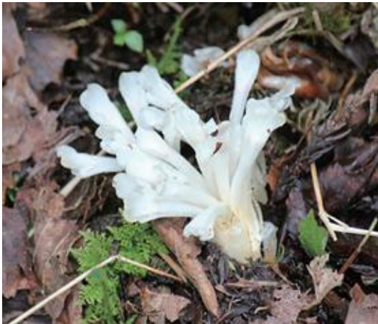
智頭町 2020.7.9

■ 選定理由 ：生育地に限られ、年により少しずつ異なる場所に出現する。開花数の年変動が大きく個体群の維持にも懸念がある。