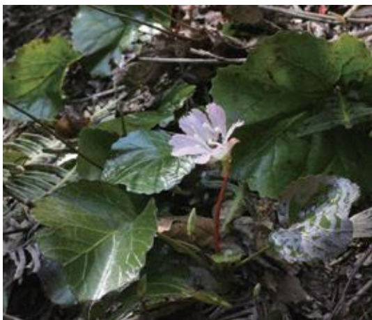
鳥取市佐治町 2021.4.25