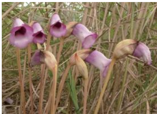
伯耆町 2021.9.7

■ 選定理由 ：ススキ草原の減少にともない本種の自生地が減少した。県内西部には比較的多いが、東部には少ない。