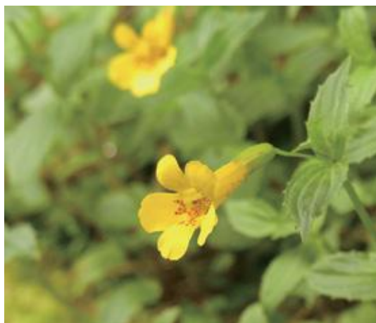
若桜町 2010.6.2

■ 選定理由 ：1987 年以來，県内では確実な記録がなかった。近年，東部 2 カ所で生育が確認されたが，1 カ所はその後シカの食害により見つからなくなった。