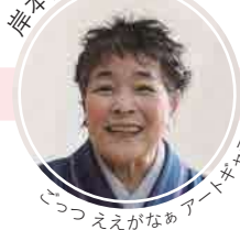
ごっつええがなアートギャラリー