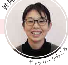
ギャラリーからふる