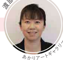
あかりアートギャラリー