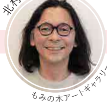
もみの木アートギャラリー