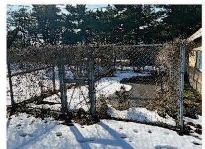
廃止した浄化槽設備（解体撤去）