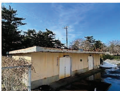
自転車格納庫（解体撤去）