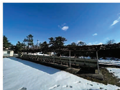
サイクルポート（解体撤去）