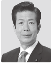
公明党代表 山口那津男

コロナ禍で傷んだ社会、激動の社会を立て直すには強力で安定感のある自公連立政権が必要です。 私たち公明党は、コロナ対策や経済、子育て、防災減災など多くの分野で実績を築き、確かな実行力を持っています。 国民の命と暮らしを守るために、これからも公明党は、「誰一人置き去りにしない社会」の実現に全力で取り組みます。