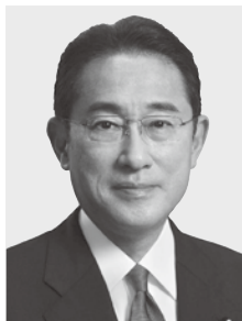
自由民主党総裁 岸田文雄