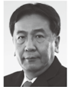
立憲民主党 代表 枝野幸男