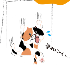
イラスト (4コママンガ可)