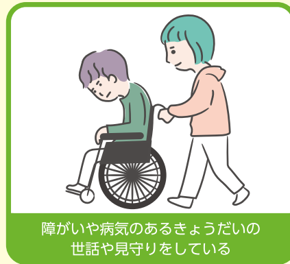
障がいや病気のあるきょうだいの世話や見守りをしている