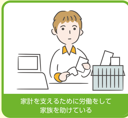
家計を支えるために労働をして家族を助けている