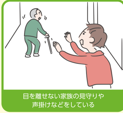
目を離せない家族の見守りや声掛けなどをしている