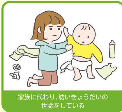
家族に代わり、幼いきょうだいの世話をしている