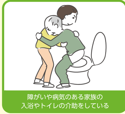
障がいや病気のある家族の入浴やトイレの介助をしている