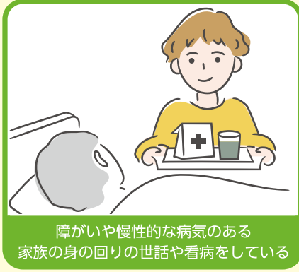
障がいや慢性的な病気のある家族の身の回りの世話や看病をしている