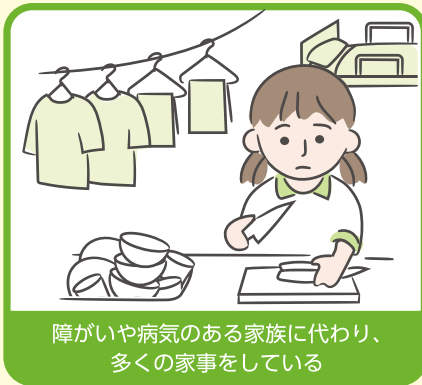
障がいや病気のある家族に代わり、多くの家事をしている