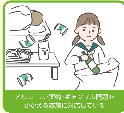
アルコール・薬物・ギャンブル問題をかかえる家族に対応している