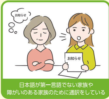
日本語が第一言語でない家族や障がいのある家族のために通訳をしている