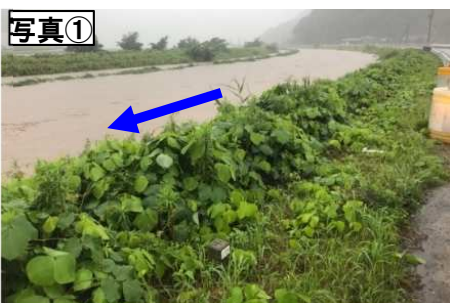
日置川 (令和3年7月7日12時30分頃)