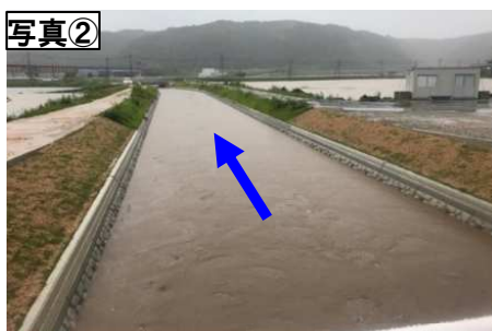
露谷川 (令和3年7月7日13時30分頃)