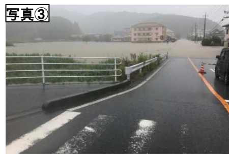
青谷町善田地区(内水被害) (令和3年7月7日12時30分頃)