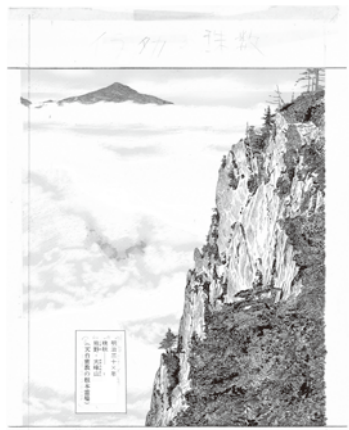
「イラタカの数珠」©パビエ

1947年～2017年。18歳まで鳥取で過ごす。その作品はヨーロッパ、アメリカ、アジア等で広く翻訳・出版され、内外の多くの漫画賞を受賞し、高く評価されている。また、『遥かな町へ』『歩くひと』『晴れゆく空』『孤独のグルメ』『神々の山嶺』『事件屋稼業』等、映画化、テレビ・ドラマ化、舞台化された作品も少なくない。